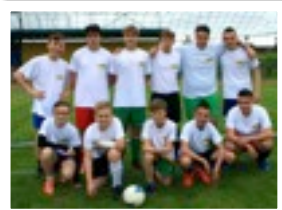
LA JEUNESSE DES SUPPORTERS