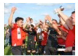
LE HOURRA DES VAINQUEURS