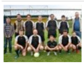
LES INDÉPENDANTS SOURIANTS