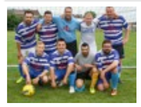
VIVA LES MARINS