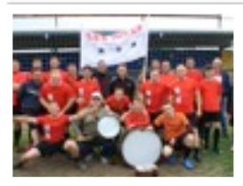
LES INCAS EN SUPER FORME