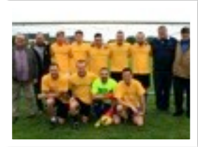
AUX RÉGUÉNAIRES LE MAILLOT JAUNE