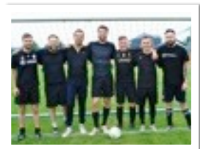
LES TOUJOURS TRÈS ARPEYANTS