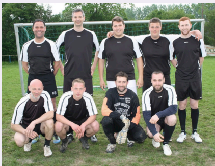
Bravo aux valeureux deuxièmes, les Indépendants...