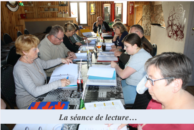
La séance de lecture...