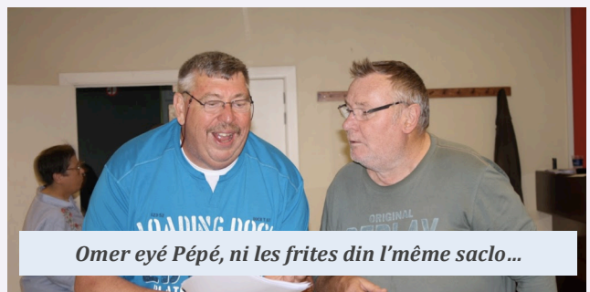
Omer eyed Pépé, ni les frites din l'même saclo...