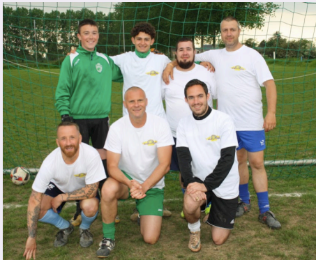
Les Supporters ont gagné le challenge.