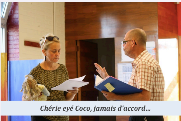
Chérie eyed Coco, jamais d'accord...