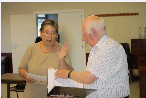
Martine ou Thérèse avec le metteur en scène

Que penser de mon personnage ? Naturellement on ne peut qu'aimer ce rôle, il me convient, j'aime cette nature extravagante à jouer qui rassurez-vous n'est pas la mienne. Je pense que tout acteur souhaiterait interpréter cette femme qui par tous les rouages de la vie veut avoir cet enfant, qui rencontre maintes difficultés et qui finalement accepte l'issue, insoupçonnable, de l'histoire.