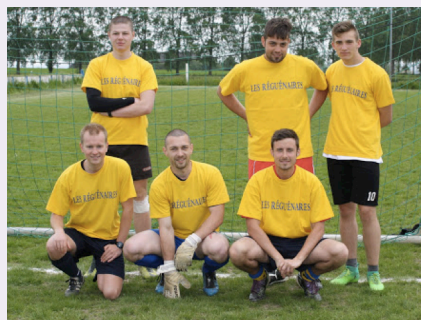
L'équipe des Régénéaires, en tête du classement du fair-play, la plus belle des coupes, c'est pour eux.