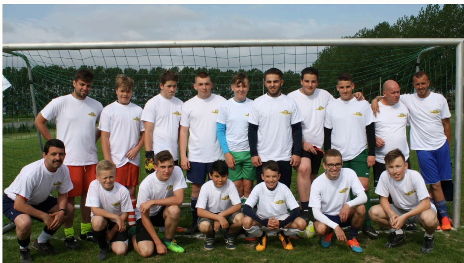
Bravo aux Supporters qui cette fois ont aligné 3 équipes ...