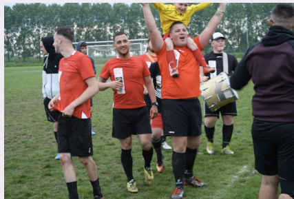
Cette fois, les Incas ont gagné la coupe de la Buvette.

Les Incas, troisième du tournoi, étaient les plus enthousiastes. Ils étaient venus en force, avec tambour et caisse pour rythmer les rencontres, une vraie soumonce en batterie !