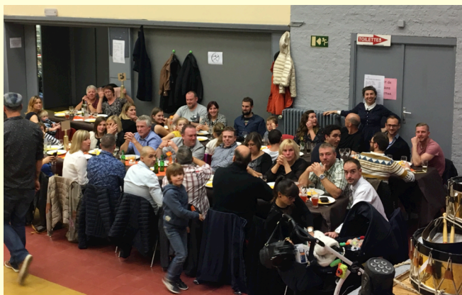
Du côté des tamboueurs, de mesdames et des enfants