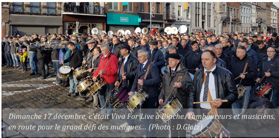
Dimanche 17 décembre, c'était Viva For Live à Binche. Tamboueurs et musiciens, en route pour le grand défi des musiques...