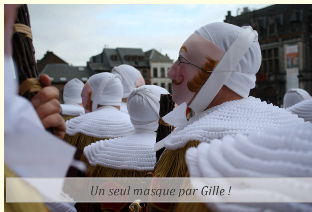
Un seul masque par Gille !

Cette fois-ci, suite à l'incendie de l'atelier Pourbaix, les masques sont comptés. Il y en aura pour tous. Soyons économes : nous recevrons un seul masque, un seul par gille.