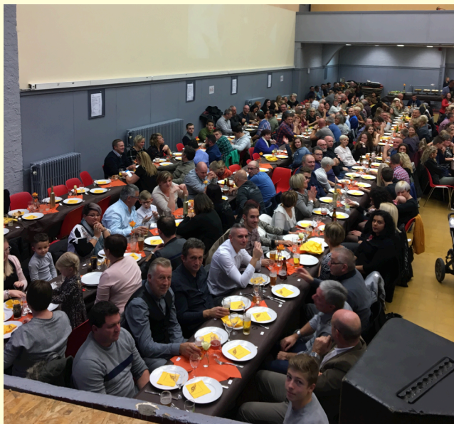
Avant l'ouverture des buffets...