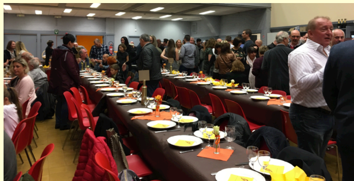
Installation... Asseyez-vous donc...