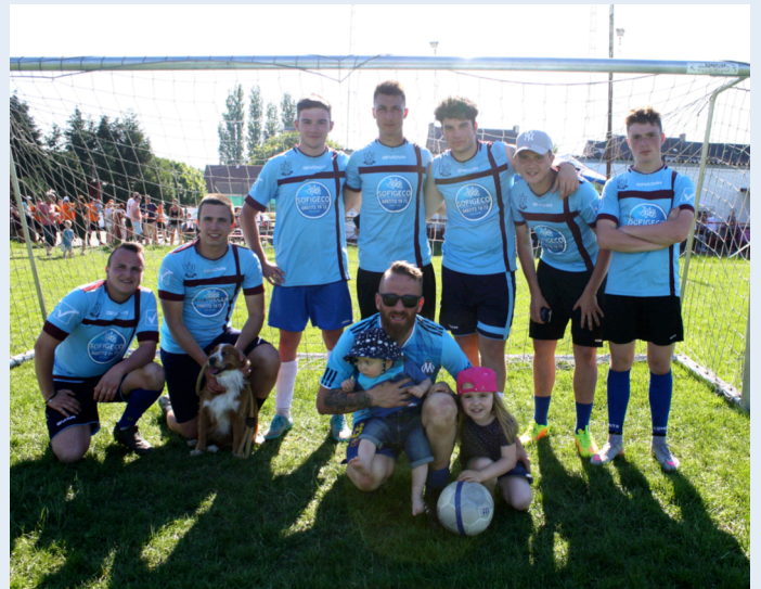
L'équipe gagnante : Les Récalcitrants

C'est l'équipe des Récalcitrants qui a remporté le tournoi, battant Les Indépendants en finale. Les Supporters arracheront cette fois la troisième place.