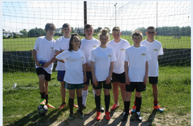
La Jeunesse des Supporters