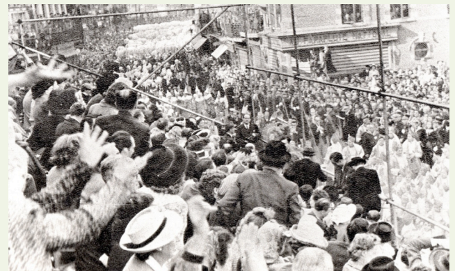
22 juin 1947, vue du cortège...

Ce n'est pas une surprise : pour un carnaval qui aura lieu les 11, 12 et 13 février, la répétition de batterie c'est le soir de la Saint-Sylvestre. Le 31 décembre, nous danserons donc sur les pavés de notre bonne ville, avant de nous souhaiter la bonne année.