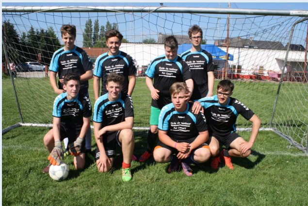
La batterie des Petits Gilles

Tous au poste : les Sociétés et leurs équipes, les joueurs, les jeunes et les moins jeunes, et la grande société des comitards et autres bénévoles pour la réussite de cette traditionnelle journée sportive. Cette année, les vélos ne sont pas là, ils reviendront l'an prochain. Place donc au foot. Avec les Incas, Récalc, Indépendants... Sans les Jeunes Indépendants qui reviendront aussi en 2018. Mais avec deux équipes des Incas pour gagner la coupe du bar!