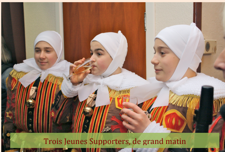
Trois Jeunes Supporters, de grand matin

Les reporters des Supporters étaient sur la brèche pour mettre en images les moments forts de nos jours gras. Et avec le numérique, des photos nous en faisons des centaines. Reste à les déposer sur notre site Web, ou encore sur notre page Facebook.