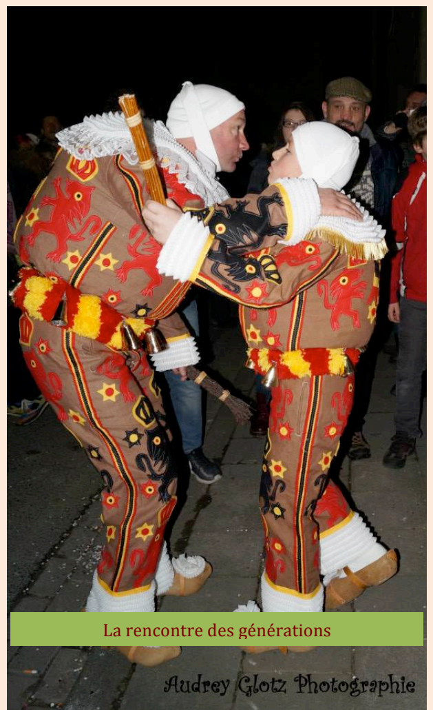
La rencontre des générations