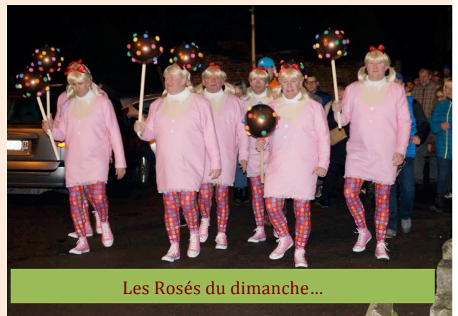
Les Rosés du dimanche...