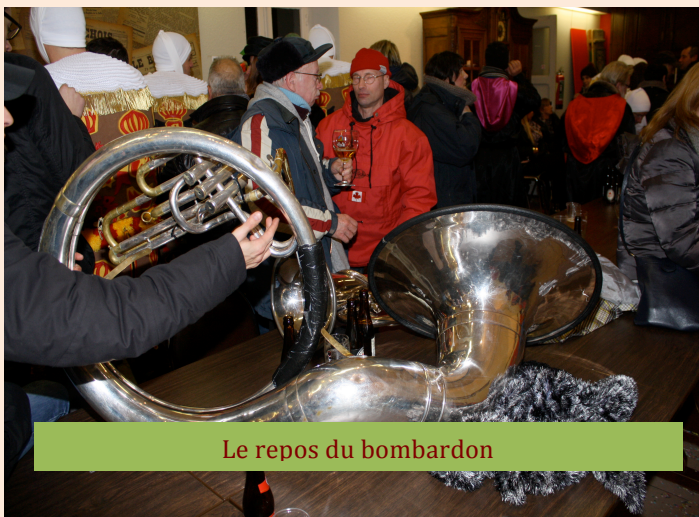
Le repos du bombardon