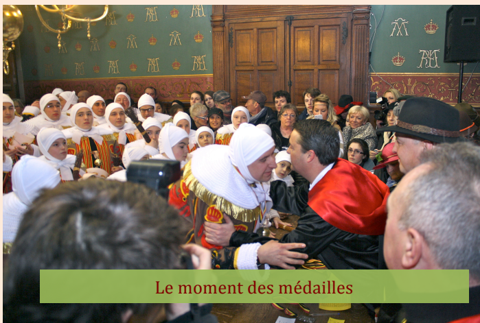
Le moment des médailles