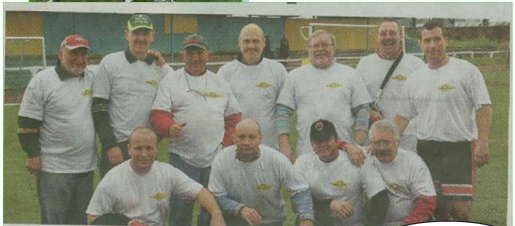
L'équipe des bénévoles des Supporters.